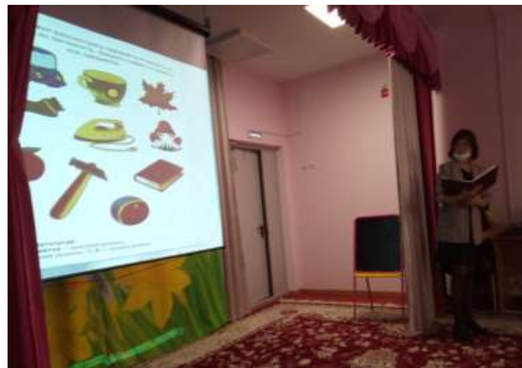
Игра «Запомни картинки»