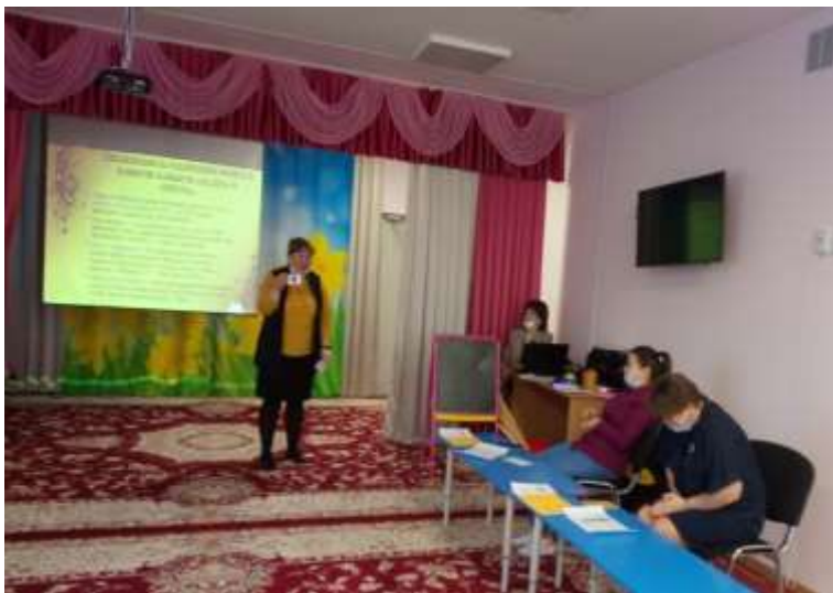
Игра «Угадай звук»