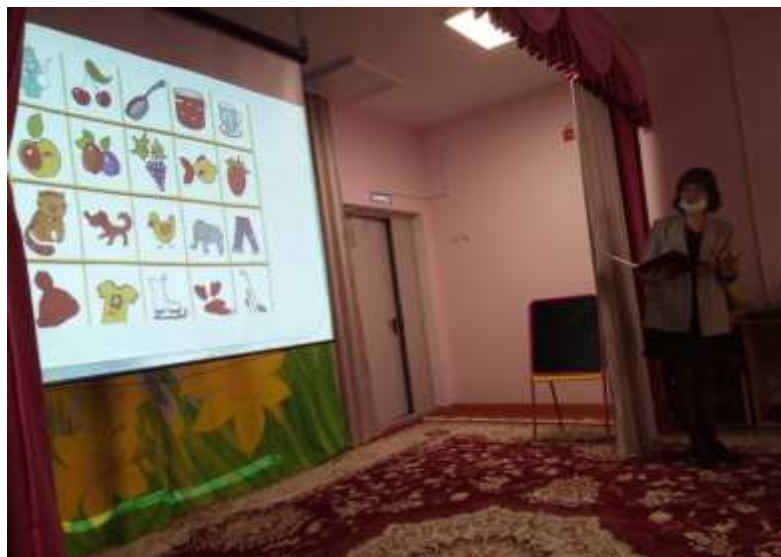
Игра «Найди лишний предмет»